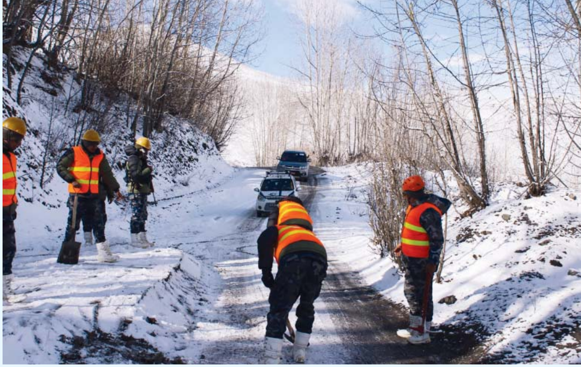
हिउँ पन्छाउँदै सशस्त्र प्रहरी

मुस्ताङको वारागुँ मुक्तिक्षेत्र गाउँपालिका-१ र २ अन्तर्गत खिगा गाउँदै भ्रारकोटदेखि रानीपौवा बजार र मुक्तिनाथ मन्दिर परिसरमा हिउँ पन्छाउँदै सशस्त्र प्रहरी । हिमपातले सवारीसाधन रोकिएपछि सशस्त्र प्रहरीको टोलीले हिउँ पन्छाएर आवतजावतमा सहज गराएको हो ।