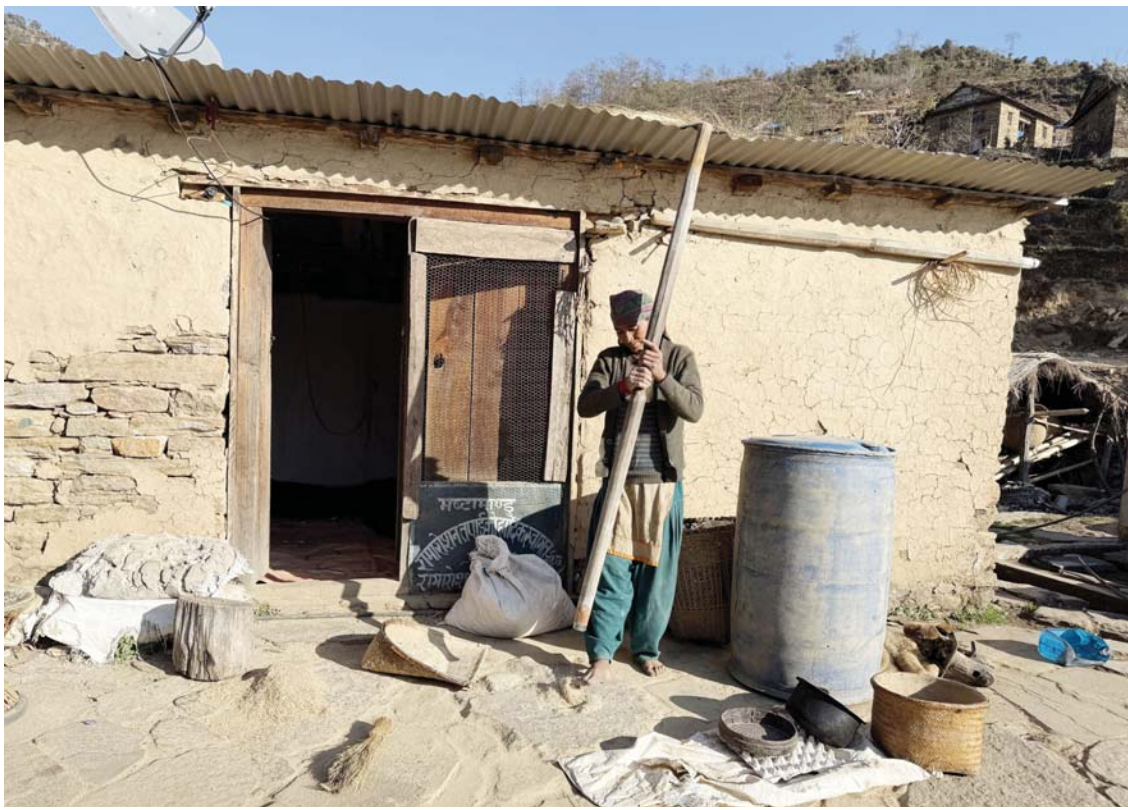
अद्यागी ओखल | अद्यागीको रामारोशन गाउँपालिका-५ का महिला ओखलमा धान कट्टे। पछिल्लो समय आधुनिक मिल्को प्रयोगसँगै घरले उद्योगका रूपमा प्रयोग हुँदै आएको ओखल प्रयोग हराउँदै गएको छ।