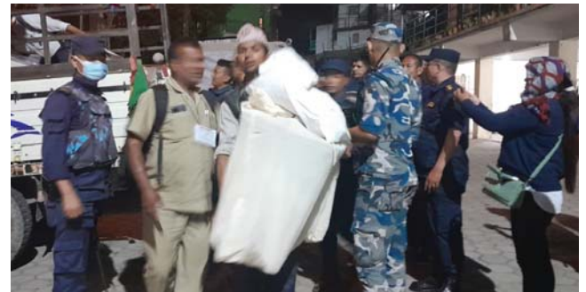
इलाम-२ मा शनिबार भएको प्रतिनिधिसभा सदस्य उपनिर्वाचनको मतपेटिका संकलन गरिँदै।