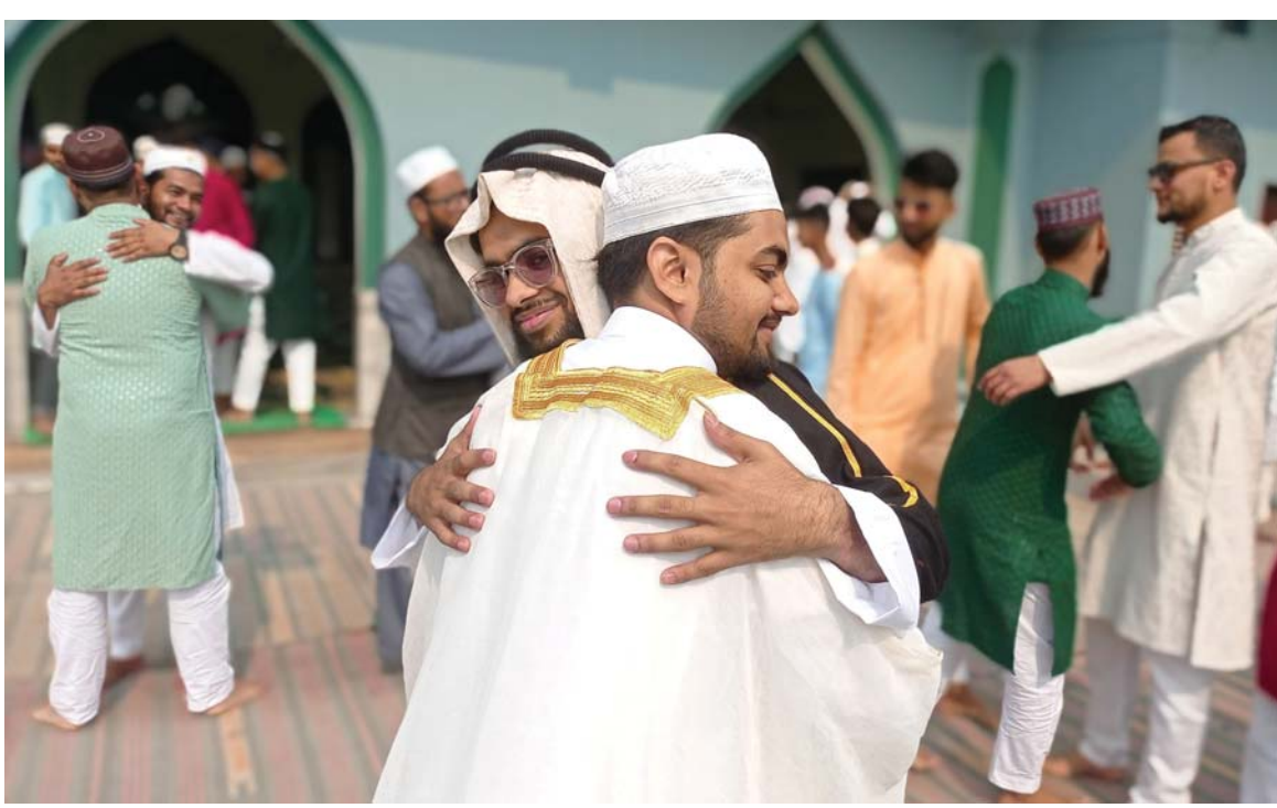
इद पर्वको शुभकामना साटासाट