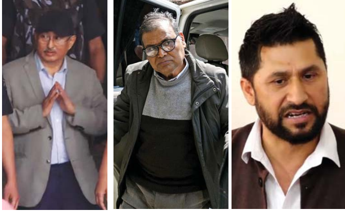
उपेन्द्र यादवले चुनाव जिते । यहाँबाट उपराष्ट्रपति रामसहायप्रसाद यादवले चुनाव जितेको थिए । उपचुनावमा कांग्रेसले एक सिट गुमायो । रास्वपाले एक सिट थप्यो । समग्रमा उपचुनावमा रास्वपाको लोकप्रियता बढ्यो । (क्रमशः पृष्ठ २ मा)

काठमाडौं- २०८० को वैशाख १ गते प्रधानमन्त्री पुष्पकमल दाहाल मन्त्रिपरिषद् विस्तारको सक्कमा थिए । कारण, कांग्रेसको आन्तरिक किचलोले मन्त्री छान्न सभापति शेरबहादुर देउवा असमर्थ थिए । यद्यपि वैशाखको पहिलो सातासम्म मन्त्रिपरिषद्ले पूर्णता पायो । १० वैशाखमा भने चितवन- २, बारा- २ र तनहुँमा उपनिर्वाचन भयो । चितवन-२ मा राष्ट्रिय स्वतन्त्र पार्टीका सभापतिसमेत रहेका वर्तमान गृहमन्त्री रवि लामिछाने र सोही दलका स्वर्णिम बाग्ले तनहुँबाट निर्वाचित भए । बाग्लेले चुनाव जितेको क्षेत्र राष्ट्रपति रामचन्द्र पौडेलको हो । बारा-२ मा जसपा अध्यक्ष