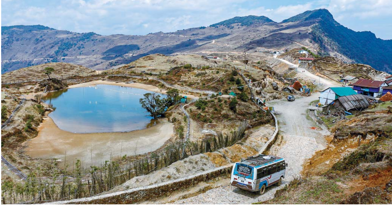
संखुवासभाको चैनपुर नगरपालिका वडा नं. १ स्थित गुफापोखरी ।

वर्ष १० अंक ३४४ काठमाडौं शुक्रबार, ३० चैत २०८० Prabhav National Daily Friday, April 12, 2024 www.prabhavonline.com पृष्ठ ८ मूल्य रु. ५१-